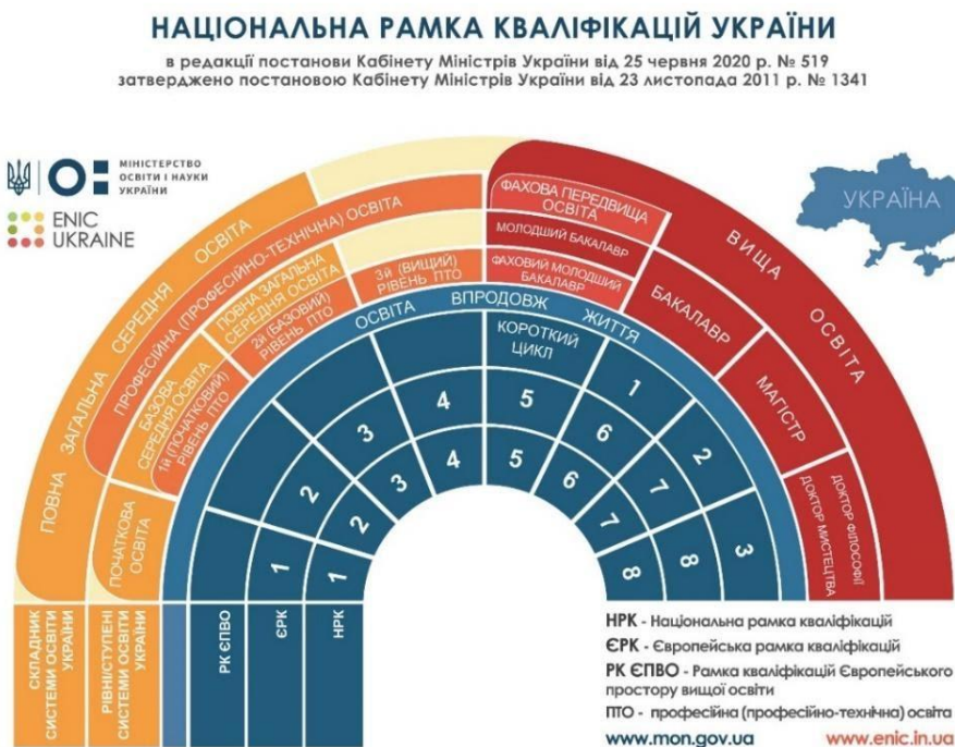
NATIONAL QUALIFICATIONS FRAMEWORK OF UKRAINE Approved by the Resolution of the Cabinet of Ministers of Ukraine № 1341, dated November 23, 2011, as amended by the Resolution of the Cabinet of Ministers of Ukraine № 519, dated June 25, 2020

Preparation in the higher education system is carried out at the initial level (short cycle) of higher education, first (bachelor's) level, second (master's) level, and third (educational-fine arts) level leading to awarding a Junior Bachelor's Degree, a Master's Degree, and Doctor of Philosophy Degree / Doctor of Fine Arts Degree respectively.